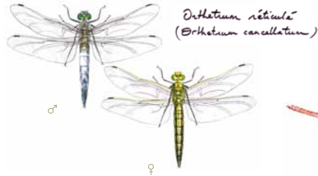
Orthetum réticulé ( Orthetum cancellatum )