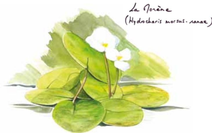
La Nourme ( Hydrocharis morsus-ranae )