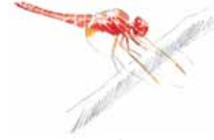
La Libellule écarlate ( Crocothemis erythraea )