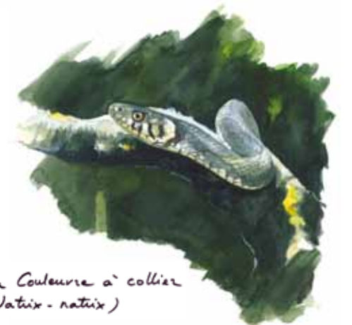
La Couleuvre à collier ( Natrix natrix )