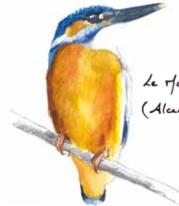
Le Martin-pêcheur d'Europe ( Alcedo atthis )