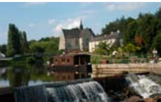
Chapelle N-D-de-Bon-Encontre (Pontivy Communauté)

Tendez l'oreille et entendez le cliquetis des épées des chevaliers de Rohan ! Carrefour de voies d'eau et de terre, la bourgade est associée au prestige d'une grande famille de l'histoire de France.